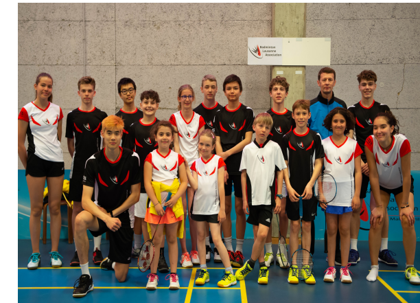
Juniors et cadres au Master Vaudois (avril 2022)