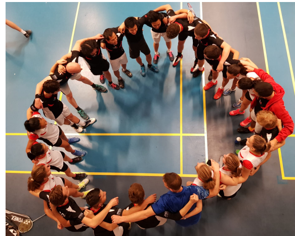
Avant un Interclub - Saison 19-20