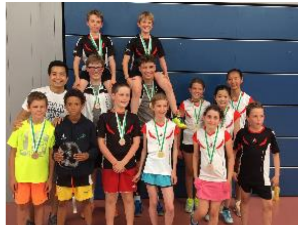
Médailles Master Vaudois (Mai 2018)