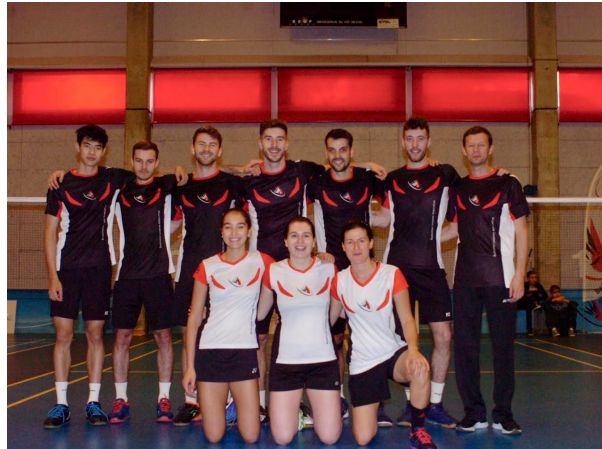
Photo d'équipe - Saison 19-20