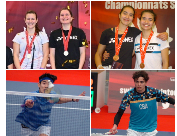
Photo Médillés Championnat Suisse 2022