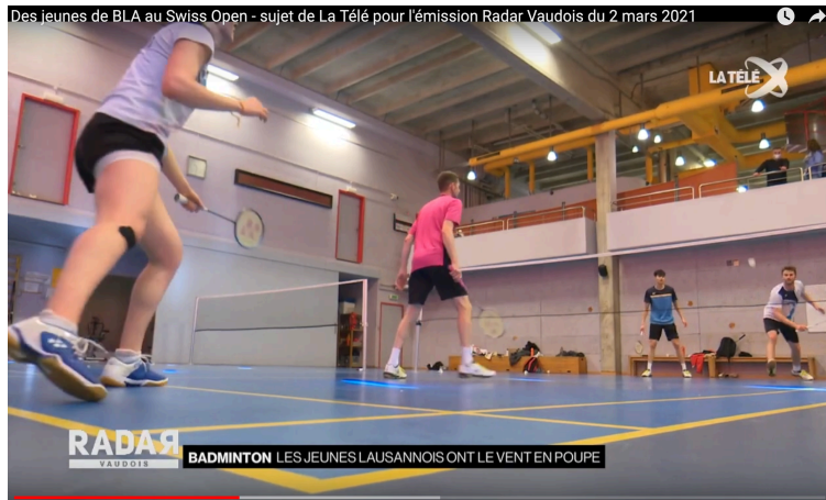
Des jeunes de BLA au Swiss Open - sujet de La Télé pour l'émission Radar Vaudois du 2 mars 2021